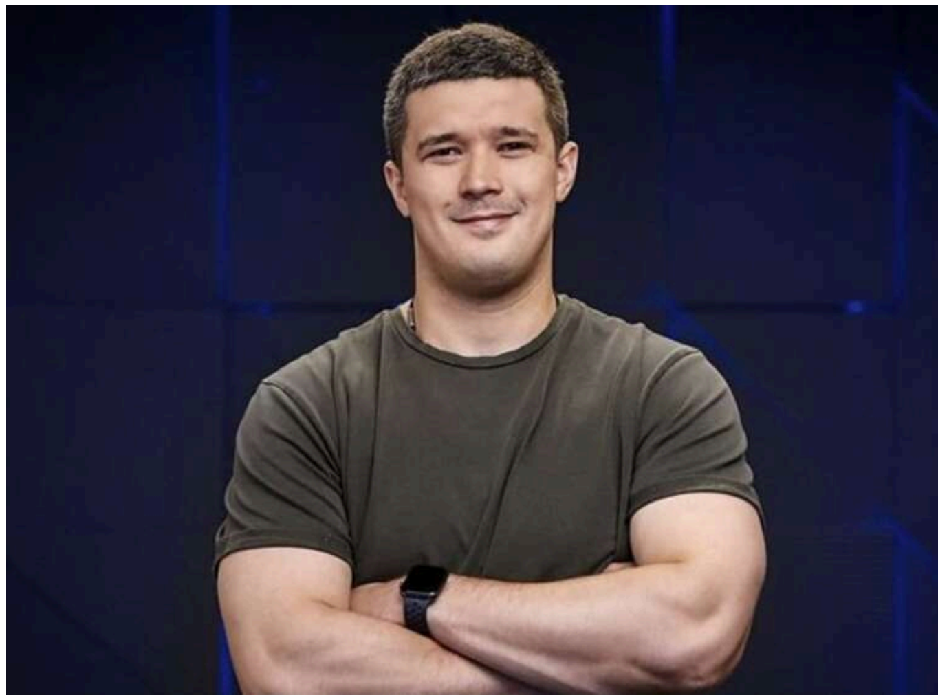
«П*здець буде»: Федоров анонсував логістичний локдаун та ізоляцію Криму

Читати на руском Read in English Додати як бажане джерело в Google