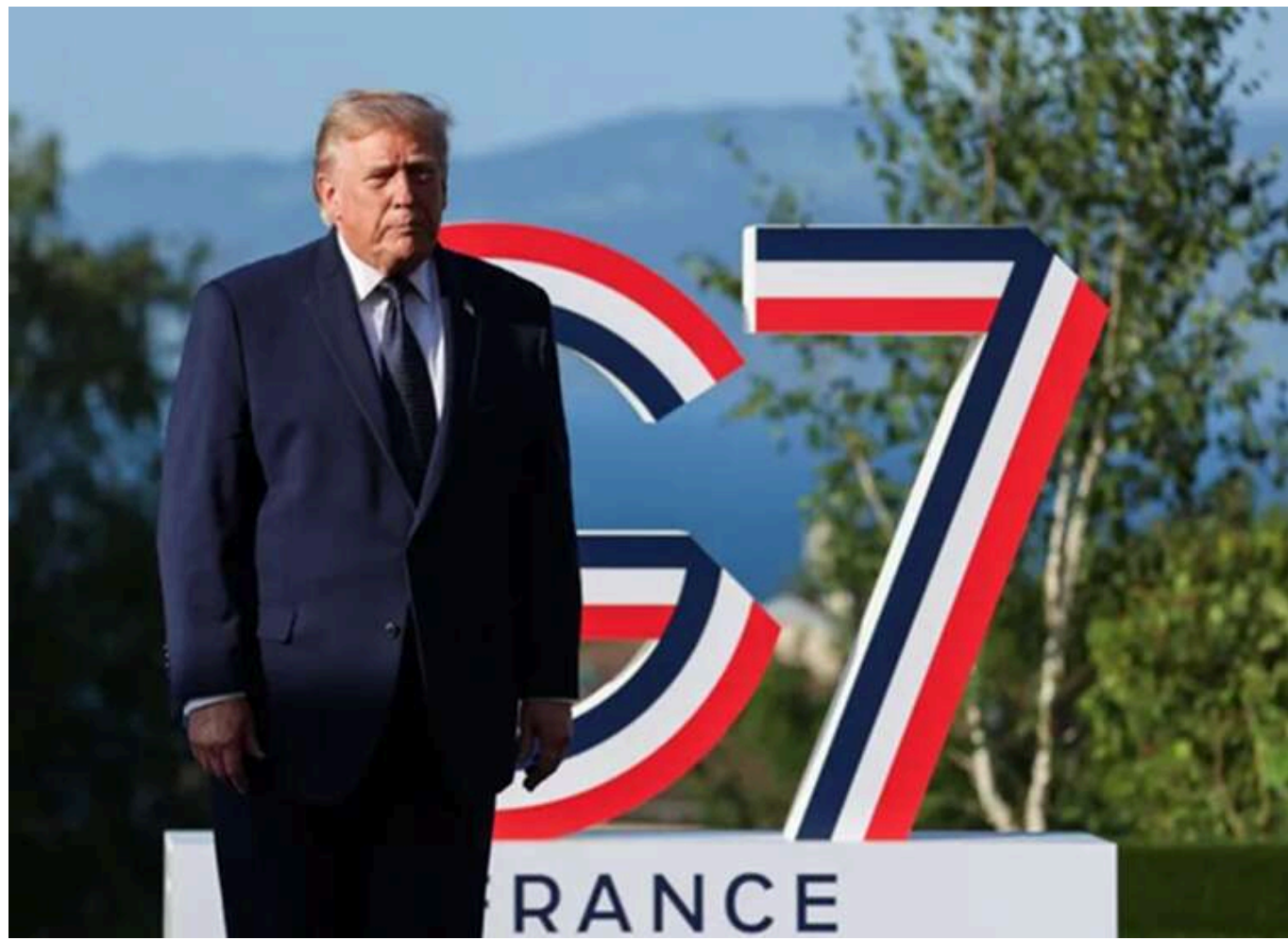
Трамп заявив про готовність повернутися до бомбардувань Ірану, якщо угоду не виконають за 60 днів

Трамп пригрозив Ірану бомбардуваннями у разі порушення зобов'язань за угодою зі США.