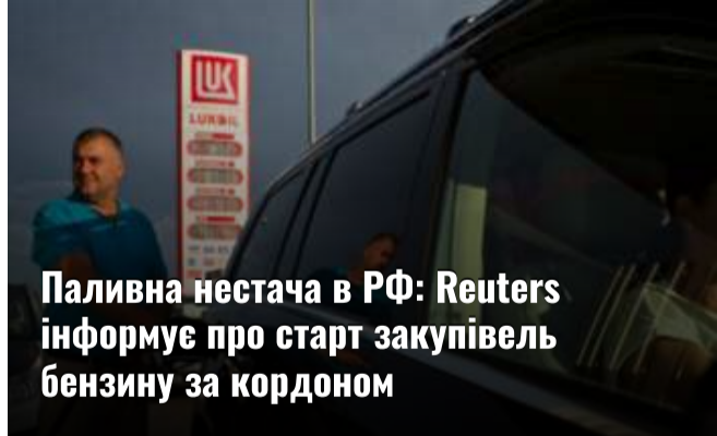
Паливна нестача в РФ: Reuters інформує про старт закупівель бензину за кордоном