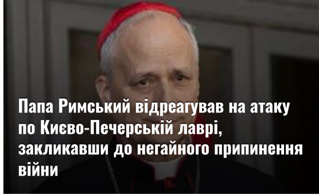
Папа Римський відреагував на атаку по Києво-Печерській лаврі, закличавши до негайного припинення війни