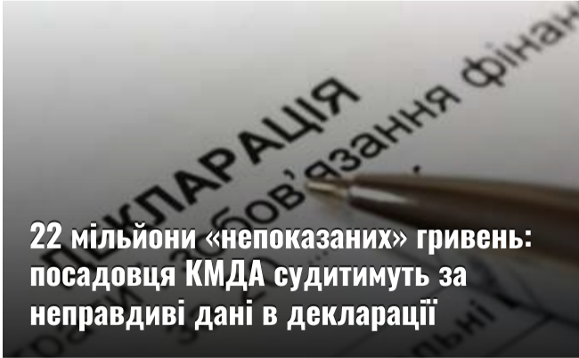
22 мільйони «непоказаних» гривень: посадовця КМДА судитимуть за неправдиві дані в декларації