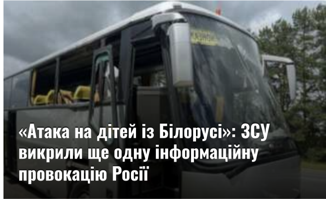
«Атака на дітей із Білорусі»: ЗСУ викрили ще одну інформаційну провокацію Росії