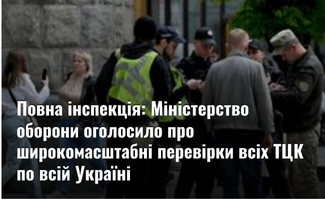
Повна інспекція: Міністерство оборони оголосило про широкомасштабні перевірки всіх ТЦК по всій Україні