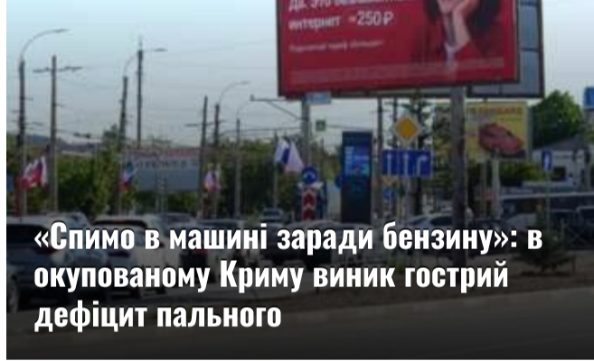
«Спимо в машині заради бензину»: в окупованому Криму виник гострий дефіцит пального