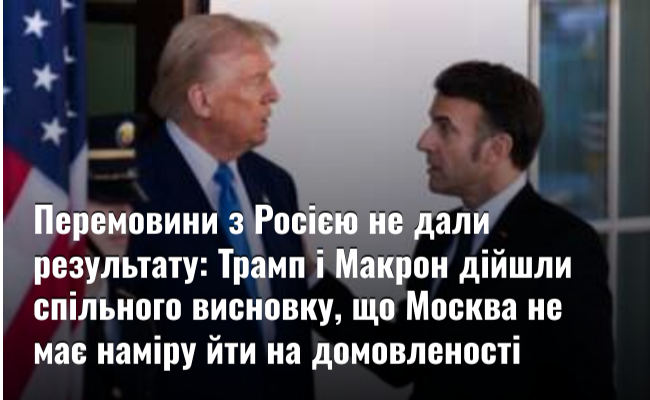
Перемовини з Росією не дали результату: Трамп і Макрон дійшли спільного висновку, що Москва не має наміру йти на домовленості