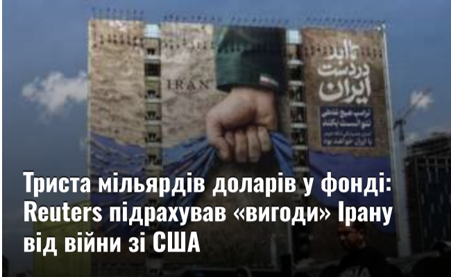
Триста мільярдів доларів у фонді: Reuters підрахував «вигоди» Ірану від війни зі США