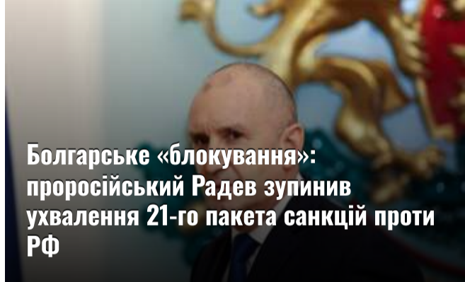
Болгарське «блокування»: проросійський Радев зупинив ухвалення 21-го пакета санкцій проти РФ