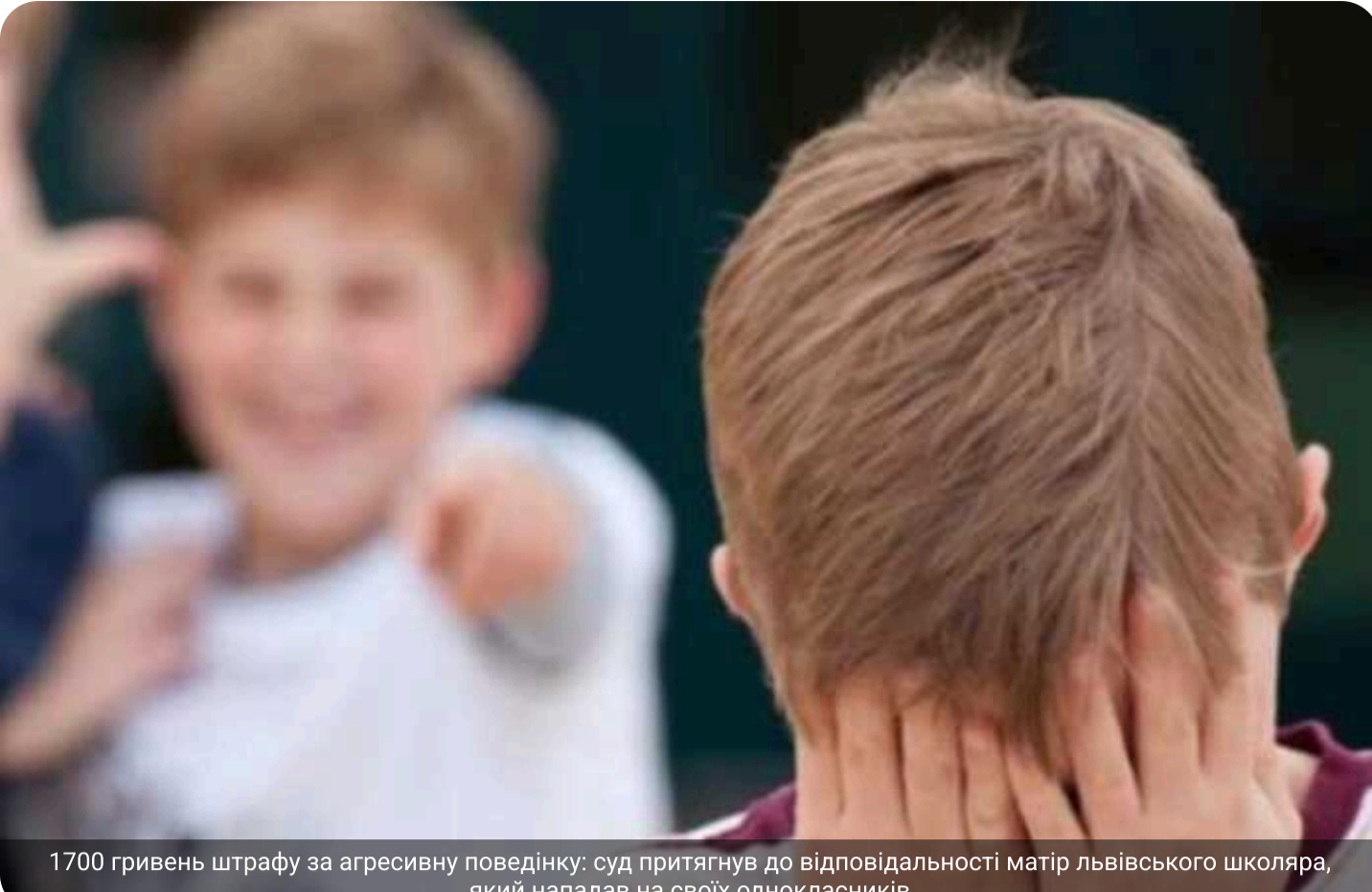
1700 гривень штрафу за агресивну поведінку: суд притягнув до відповідальності матір львівського школяра, який нападав на своїх однокласників

Залізничний районний суд м. Львова притягнув до адміністративної відповідальності матір учня 6 класу за фактом вчинення її сином булінгу. Встановлено, що підліток завдав тілесних ушкоджень двом однокласникам, наносячи удари в живіт та голову. Суд призначив жінці штраф у розмірі 1700 грн.