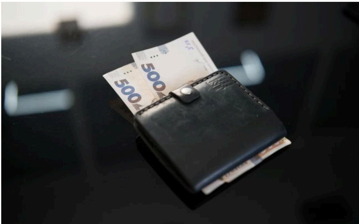
Фото: В Україні змінили правила нарахування допомоги постраждалим від війни