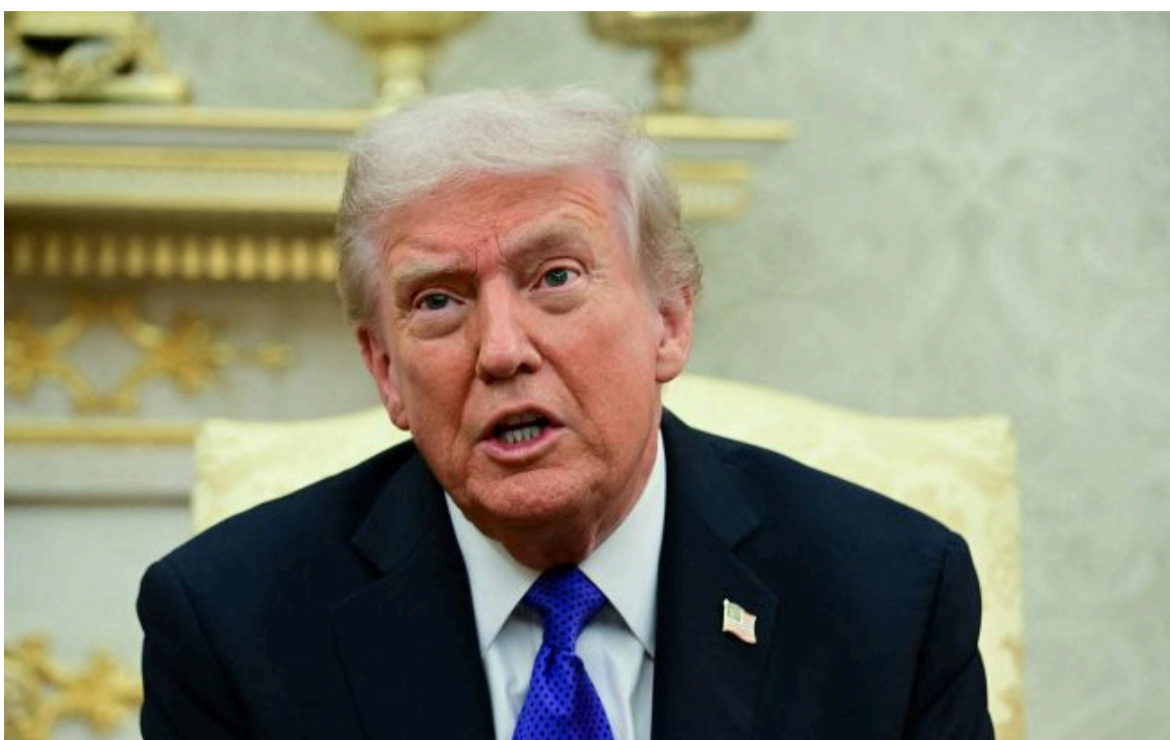
Фото: Дональд Трамп, президент США

Не витрачай час на шум! Читай тільки суть з РБК-Україна у Google