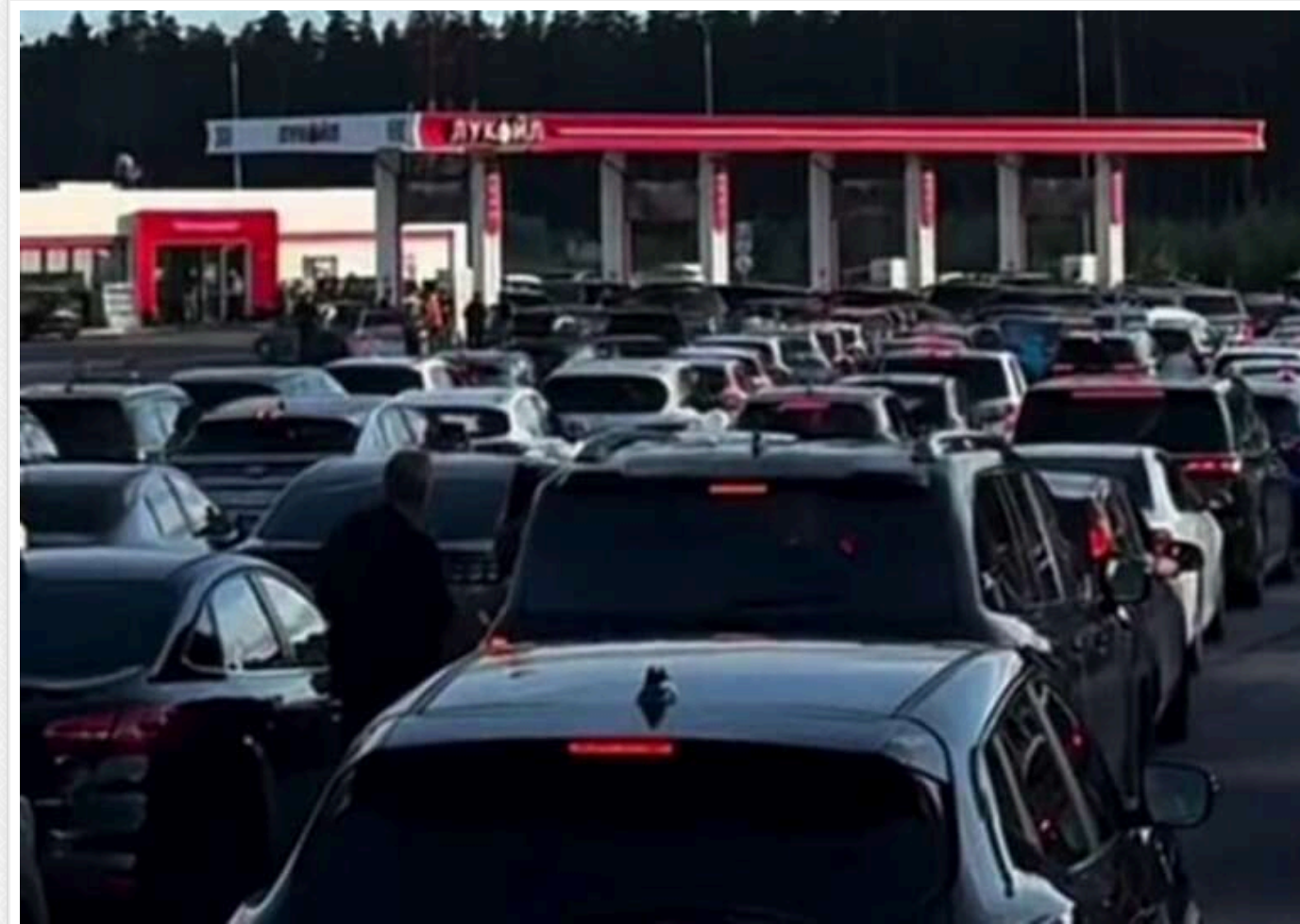
Звинувачують олігархів і владу: Росіяни визнають дефіцит пального, але не пов'язують його з ударами по НПЗ

Читати на руском Додати як бажане джерело в Google