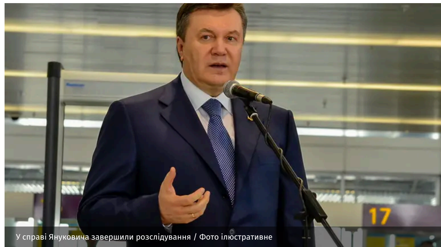
У справі Януковича завершили розслідування / Фото ілюстративне

Прокурори Офісу Генерального прокурора спільно зі слідчими ДБР завершили спеціальне досудове розслідування щодо Віктора Януковича та ще 16 колишніх високопосадовців. Йдеться про справу щодо створення та діяльності злочинної організації, яку, за версією слідства, очолив президент-утікач у 2010 – 2014 роках.