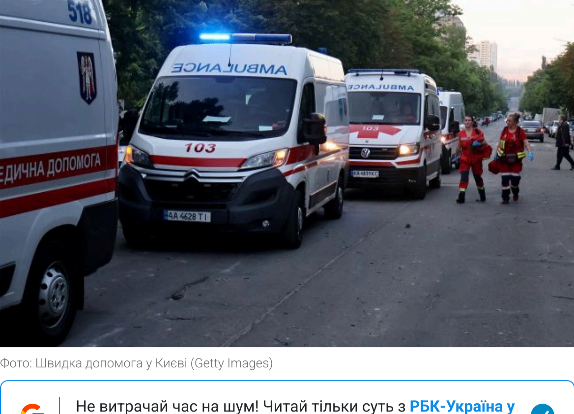
Фото: Швидка допомога у Києві

Не витрачай час на шум! Читай тільки суть з РБК-Україна у Google