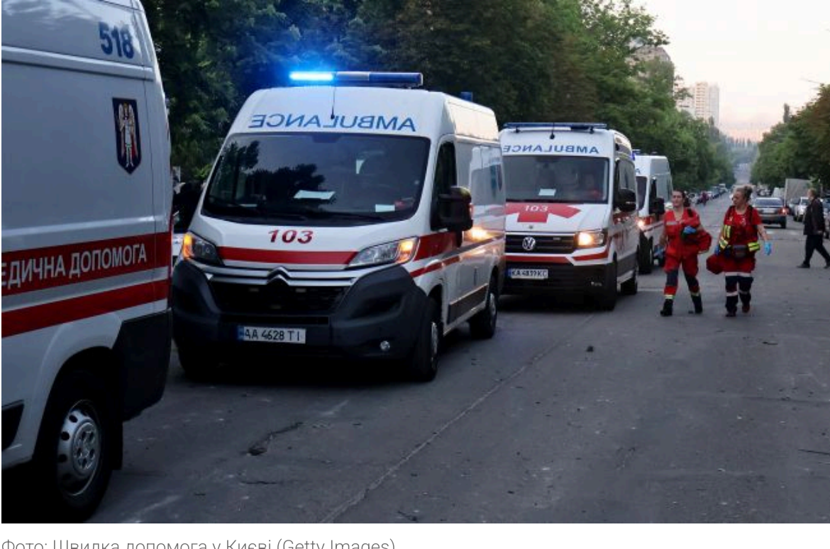
Фото: Швидка допомога у Києві (Getty Images)

🔍 Не пропустіть головне! Підпишіться на наші оновлення в Google!