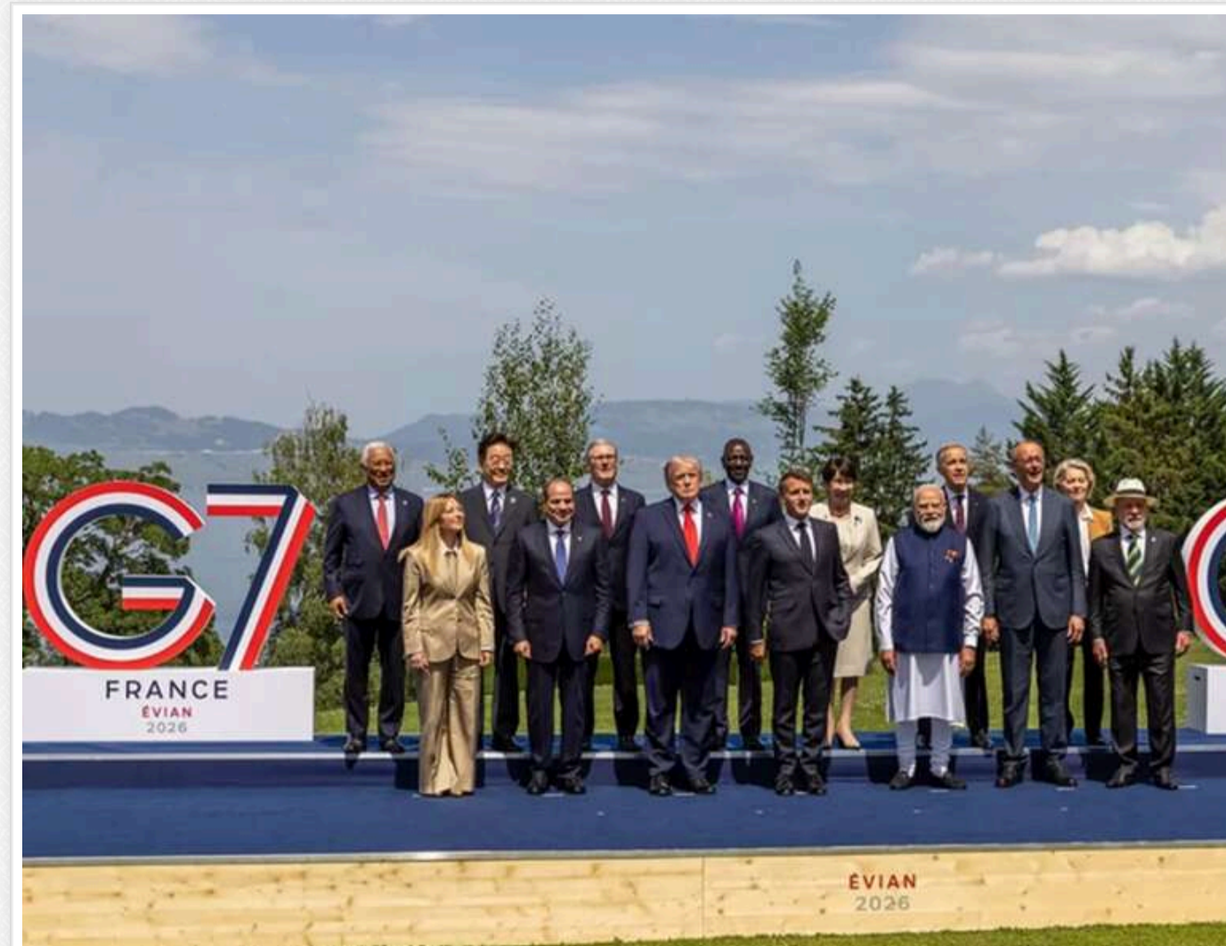
Зброя «глибокого удару»: європейські лідери G7 погодили спільне виробництво ракет в Україні

Країни Європи, які входять до «Групи семи», не лише запустять в Україні ліцензійне виробництво систем протиповітряної оборони, а й займуться виготовленням далекобійних засобів ураження.