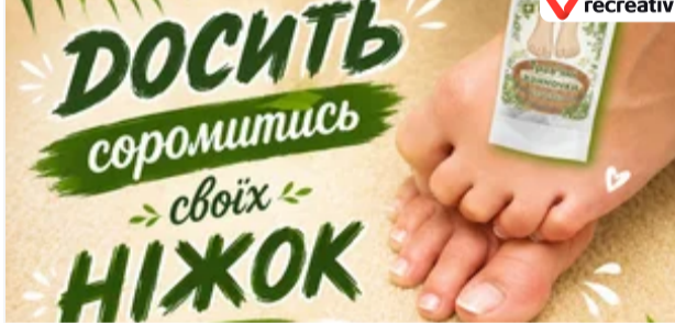
САМОЛІКУВАННЯ МОЖЕ БУТИ ШКОДИВИМ ДЛЯ ВАШОГО ЗДОРОВ'Я

Гроші впадуть з неба після того, як прочитаєш це