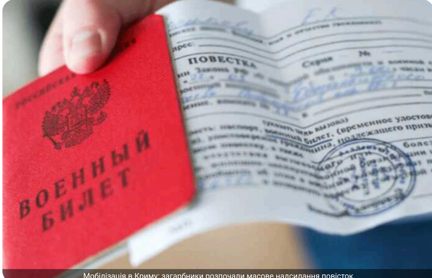
Мобілізація в Криму: загарбники розпочали масове надсилення повісток

В окупованому Криму загарбники розпочали нову хвилю прихованої мобілізації: окупаційна влада проводить масове оповіщення військовозобов'язаних резервістів. Ті, хто прибуває до військкоматів, одразу отримують мобілізаційні приписи на подальшу службу.