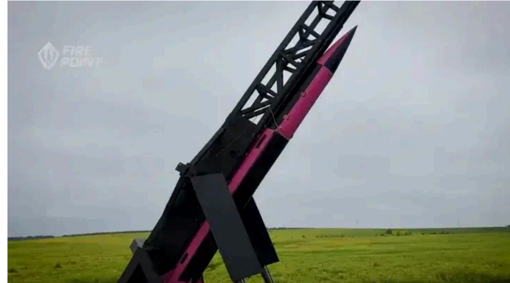
Українська FP-7.x обійдеться приблизно в 5 разів дешевше за американський аналог.

Головна відмінність – це економіка війни. Збирання американських PAC-3 в Україні знизить їхню вартість з космічних 3,8–5,3 млн доларів до 2,8–3,5 млн за одиницю (оскільки складні високотехнологічні вузли все одно доведеться імпортувати). Наша ж FP-7.x обійдеться приблизно в 5 разів дешевше за «американця». Завдяки більш простій конструкції та низьким витратам Україна зможе налагодити справді масовий випуск цих боеприпасів.