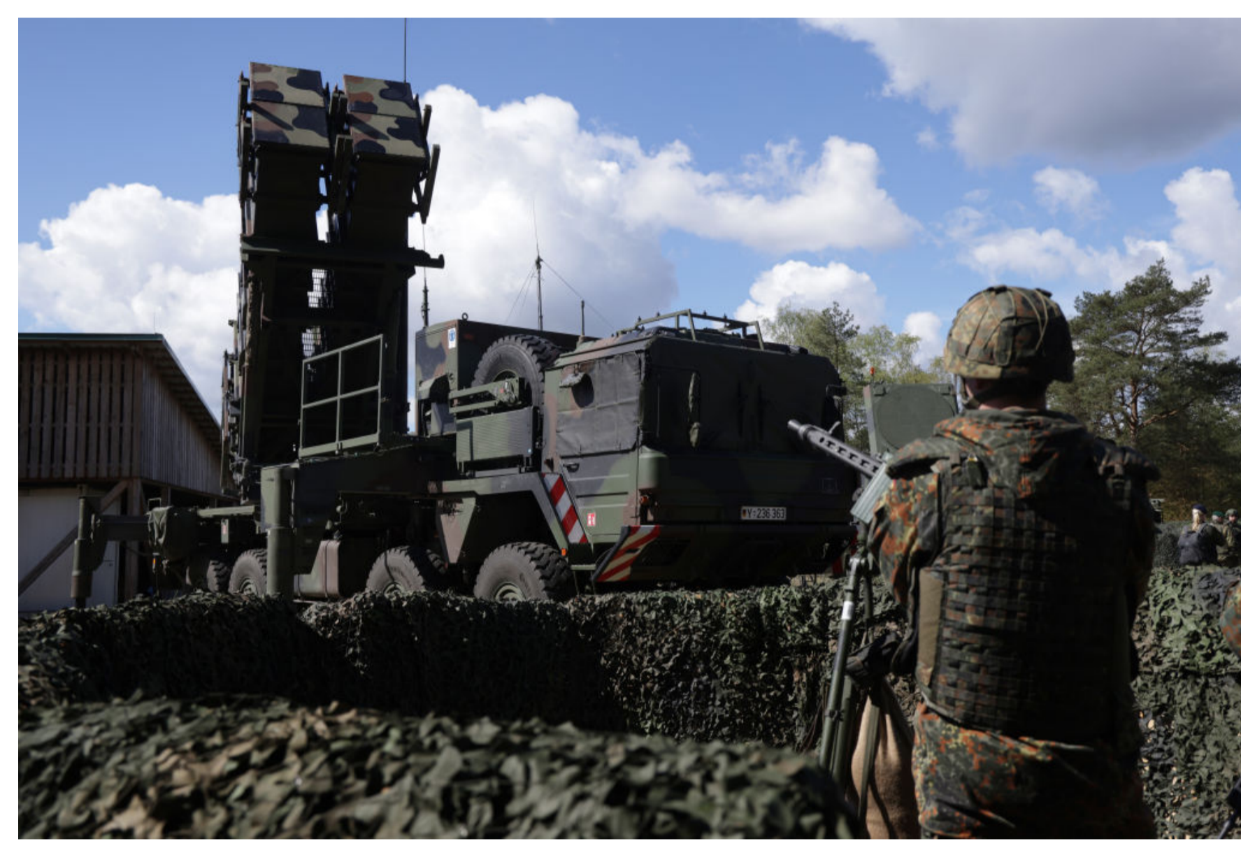
Комплекси Patriot нам, як і раніше, не вистачає, але є інша позитивна тенденція.

Але разом із перевагами може виникнути й низка труднощів. Виробництво сучасних ракет потребує високоточних верстатів, мікросхем та специфічної сировини, яку Україні все одно доведеться імпортувати. Крім того, будь-яке оборонне підприємство на території України автоматично стає пріоритетною цілью для російських ударів, тому виробництво вимагатиме посиленого захисту ППО чи глибокого підземного розміщення.