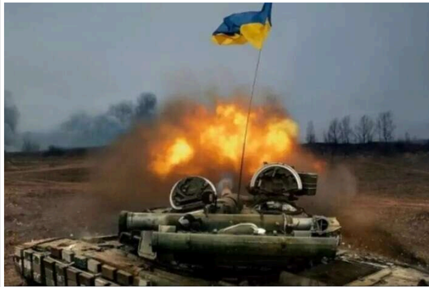
Дводенний штурм на мотоциклах та бронетехніці: десантники 81-ї бригади зупинили атаку ворога на Слов'янському напрямку

Читати на руськом Read in English Додати як бажане джерело в Google