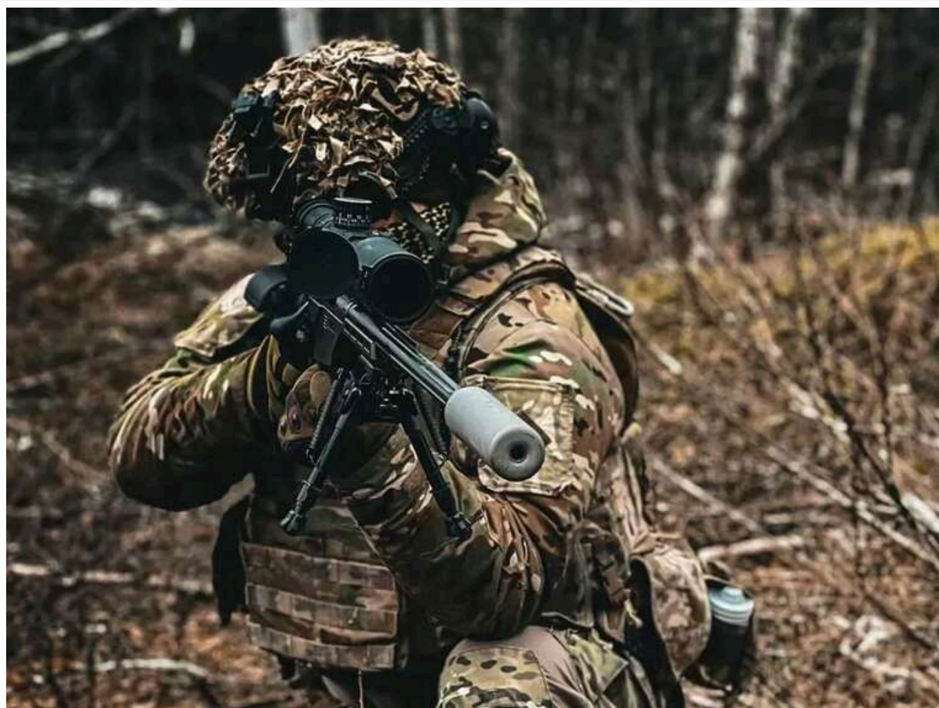
Ситуація на фронті: Зафіксовано 55 боєзіткнень, найгарячіше – на Гуляйпільському та Покровському напрямках

З початку доби середи, 17 червня, російські загарбники 55 разів обстріляли та атакували позиції Сил оборони України.