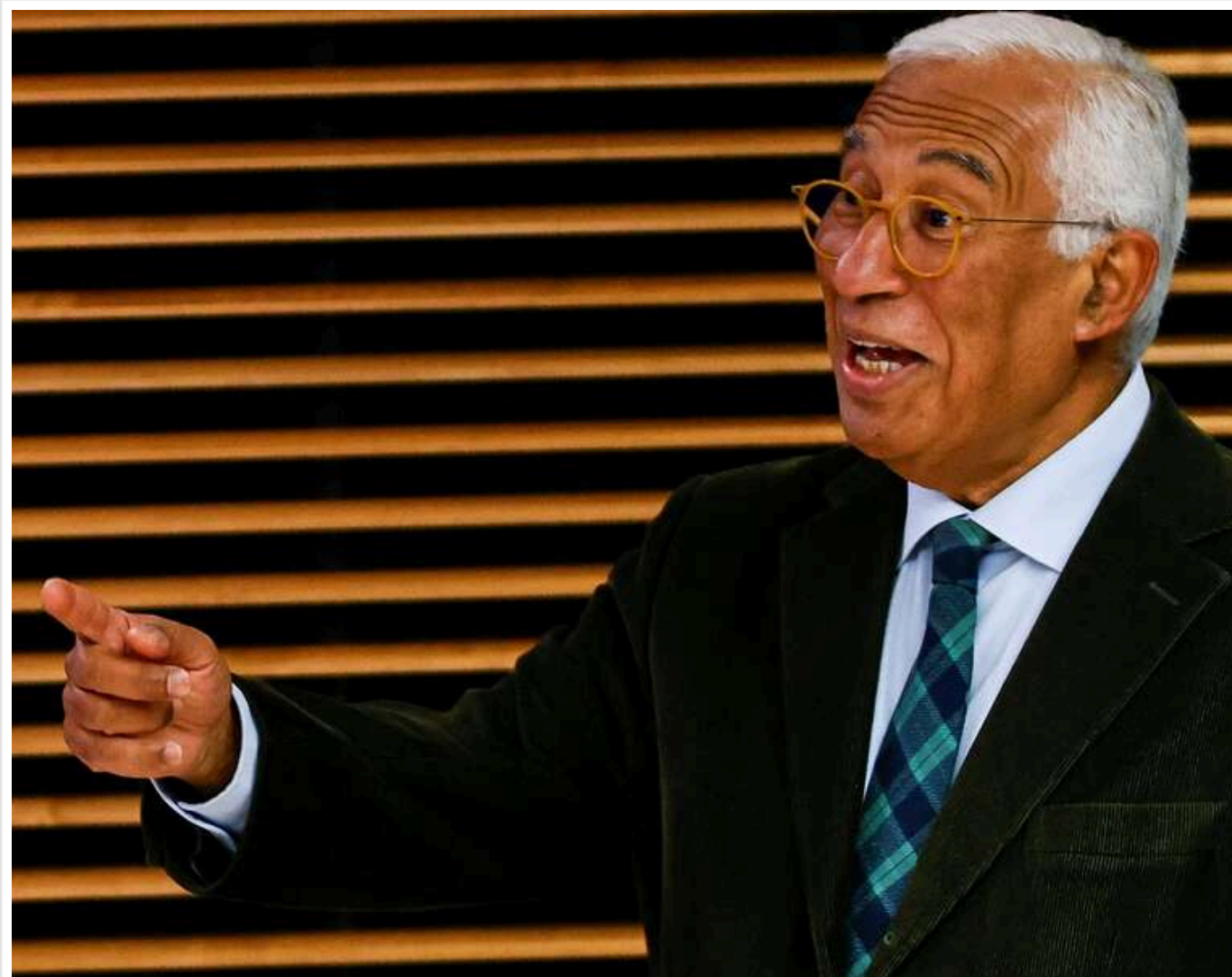
Bloomberg: Голова Євроради Антоніу Кошта розпочав неформальні переговори з Кремлем щодо України

Голова Європейської ради Кошта розпочав переговори з Кремлем щодо українського питання, повідомляє Bloomberg з посиланням на джерела.