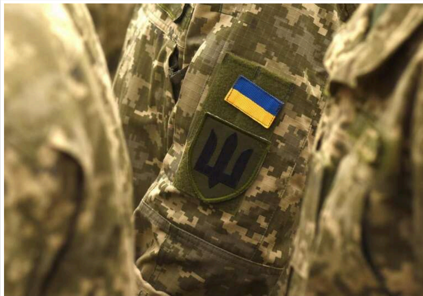
Після скандалу в Одесі: у всіх ТЦК проведуть службові перевірки, — Міноборони