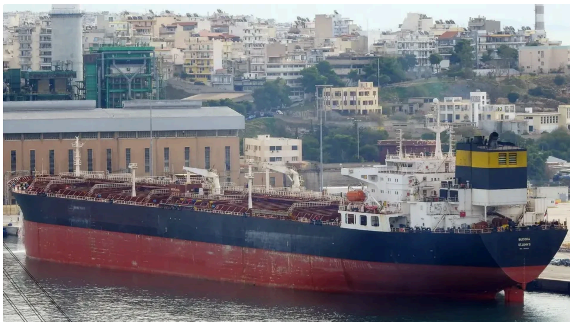
FINA A перебуває під санкціями ЄС, Швейцарії, Британії та України

17 червня, 16.22 🗣️ Этот материал также можно прочитать на русском