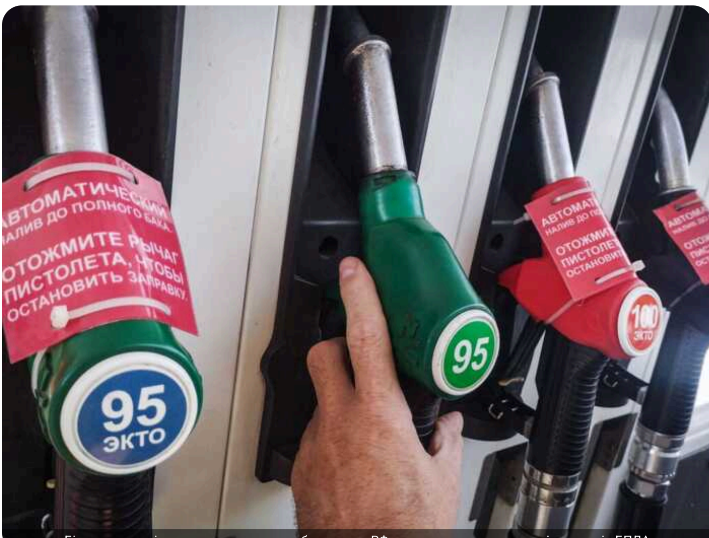
Білорусь утричі наростила постачання бензину до РФ через нестачу пального після ударів БПЛА.

Білорусь у період з 1 по 15 червня збільшила залізничні поставки автобензинів зі своїх нафтопереробних заводів на російський ринок майже в три рази порівняно з тим самим періодом попереднього місяця - до понад 70 000 тонн.