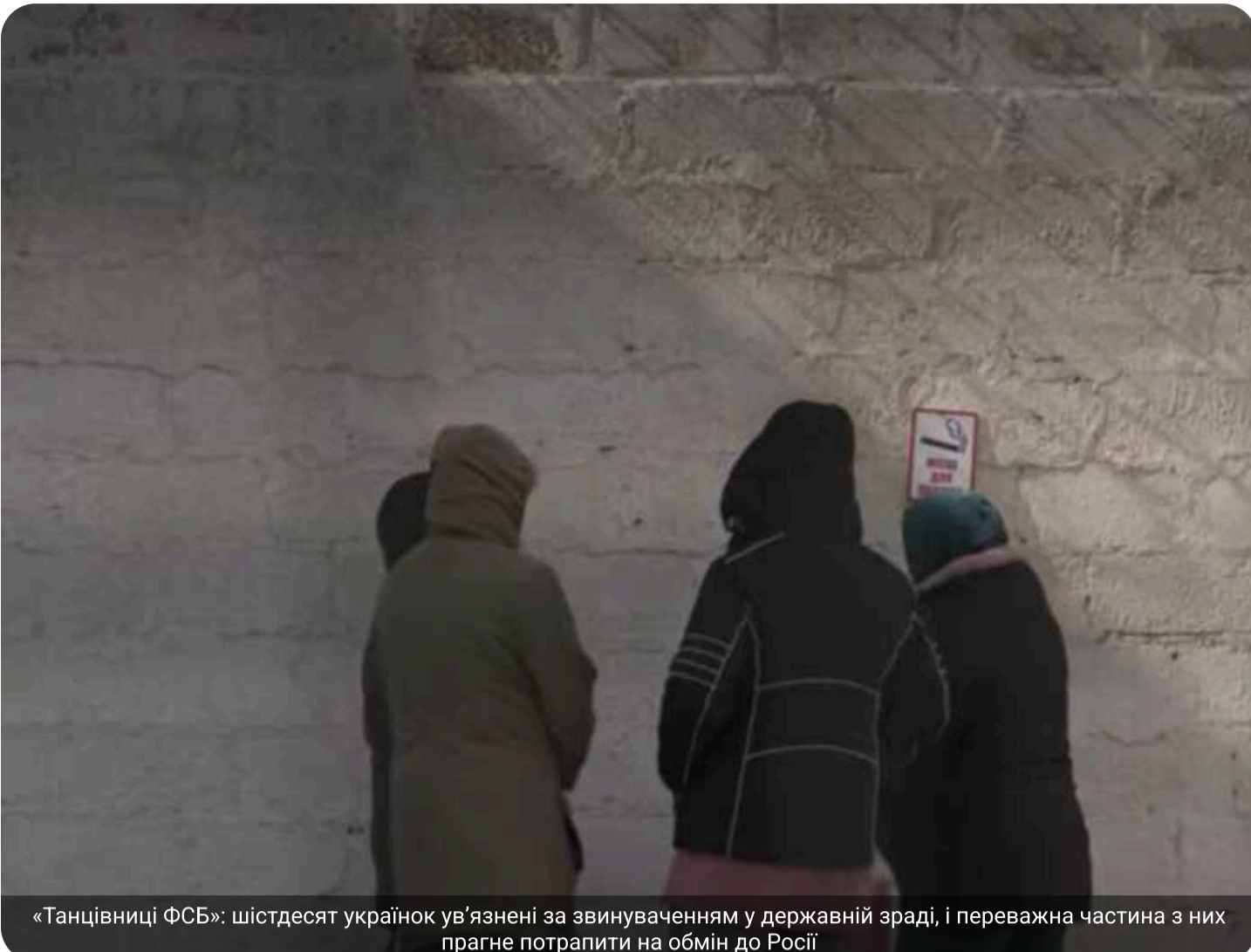
«Танцівниці ФСБ»: шістдесят українок ув'язнені за звинуваченням у державній зраді, і переважна частина з них прагне потрапити на обмін до Росії

У Міністерстві юстиції, 60 українок відбувають покарання у в'язницях за статтею про державну зраду. Троє з них мають довічні вироки. Більшість жінок, які засуджені за злочини проти основ національної безпеки, написали заяви, що хочуть бути обміняні в Росію як військовополонені, хоча за міжнародним гуманітарним правом такого статусу вони не мають.