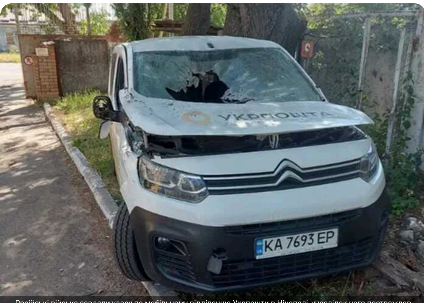
Російські війська завдали удару по мобільному відділенню Укрпошти в Нікополі, унаслідок чого постраждав чоловік

Ворог знову вцілів у пересувне відділення Укрпошти в Нікополі. Сталося це 17 червня. Постраждав водій. Автівки поштового оператора систематично опиняються під прицілом на прифронтових і прикордонних територіях.