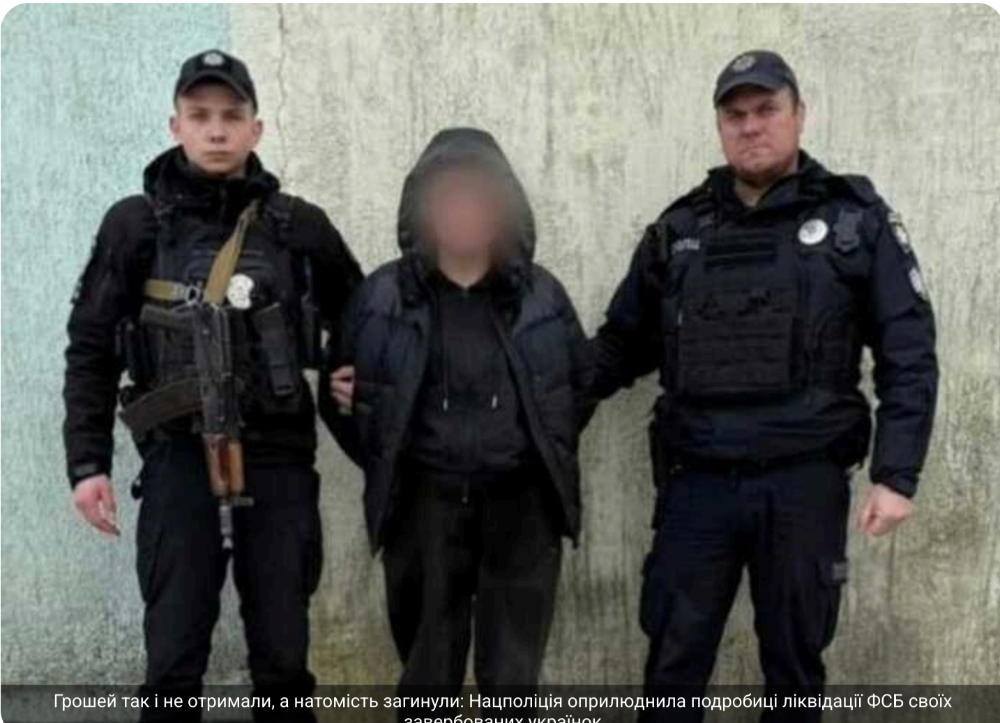
Грошей так і не отримали, а натомість загинули: Нацполіція оприлюднила подробиці ліквідації ФСБ своїх завербованих українок

Впродовж минулого року правоохоронці затримали 83 людей, які готувалися скоїти терористичні акти або ж вже це зробили. Серед них було 16 жінок та п'ятеро неповнолітніх дівчат. Від початку 2026 року в Україні зафіксований вже 21 терористичний акт. Затримали 23 імовірних виконавців, серед яких семеро — жінки. Про це журналістам «Слідства.Інфо» повідомили у Національній поліції України. Докладно про те, як Росія вербує українських жінок «Слідство.Інфо» розповідає у фільмі «Балерини ФСБ. Українки на службі у росіян».