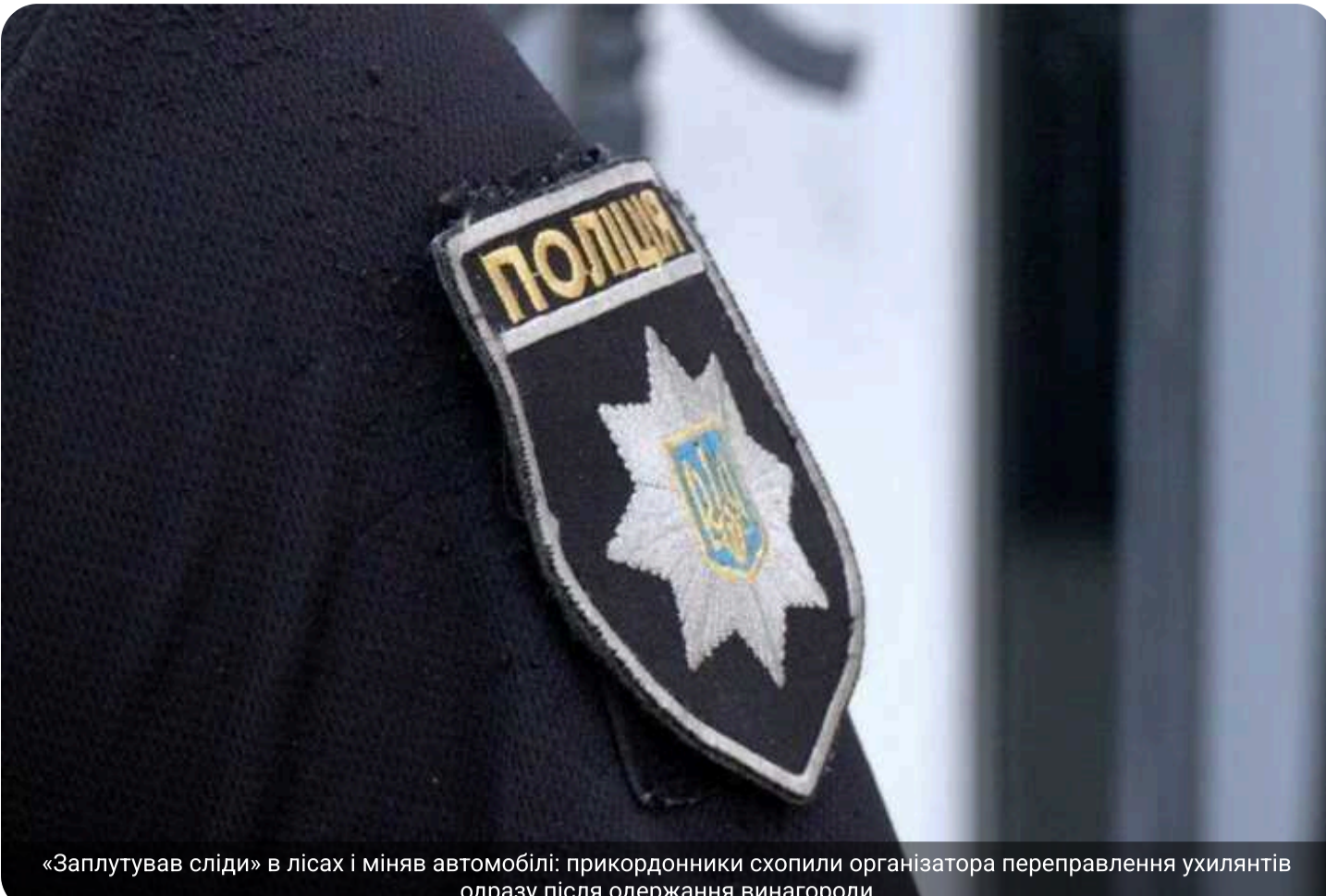
«Заплутовув сліди» в лісах і міняв автомобілі: прикордонники схопили організатора переправлення ухлянтів одразу після одержання винагороди

Організатор «бізнесу» пропонував бажаним незаконно покинути країну повний спектр послуг: від транспортування з місця проживання до супроводу прикордонням. Щоб уникнути викриття, підозрюваний ретельно приховував кожен свій крок. Проте поліцейській затримали зловмисника одразу під час спроби переправити чоловіків до Румунії.