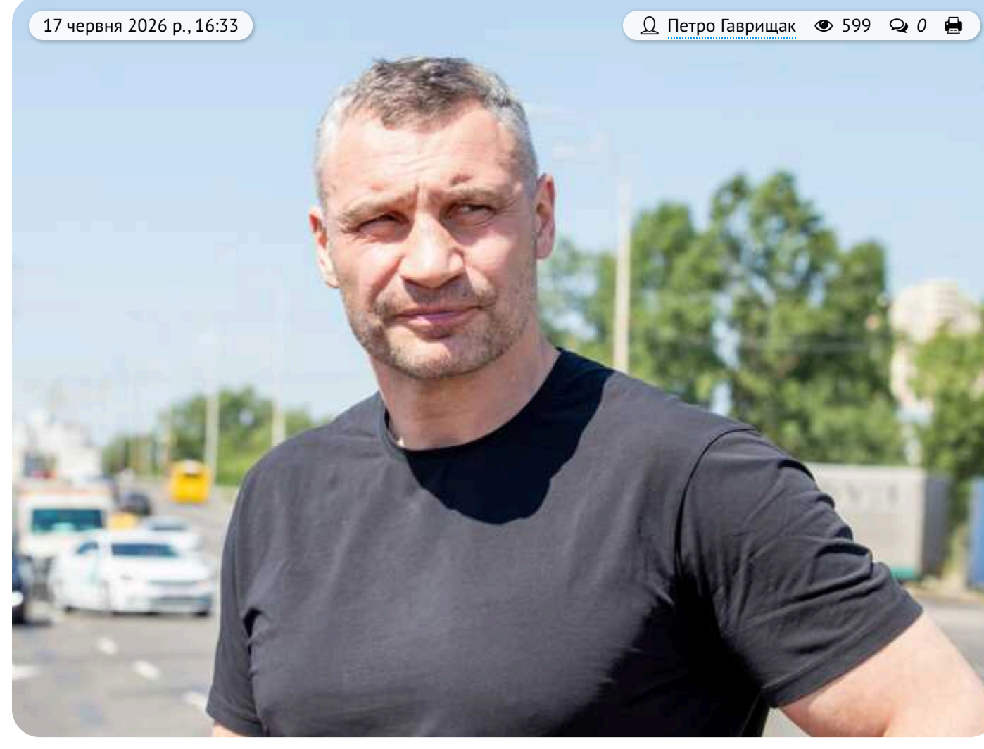
Мільйони в тінь через підставні ТОВ: Нацполіція викрила посадовців «Київтеплоенерго» та «Київпастрасу» на схемі відмивання коштів

Наразі Печерське управління Нацполіції Києва вичає факти виведення коштів, у т.ч. зі столичного бюджету, у тіньовий сектор через різні сумнівні компанії.