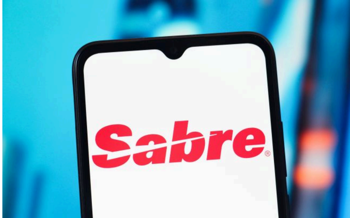
Фото: Британія виписала найбільший штраф за порушення санкцій (Getty Images)