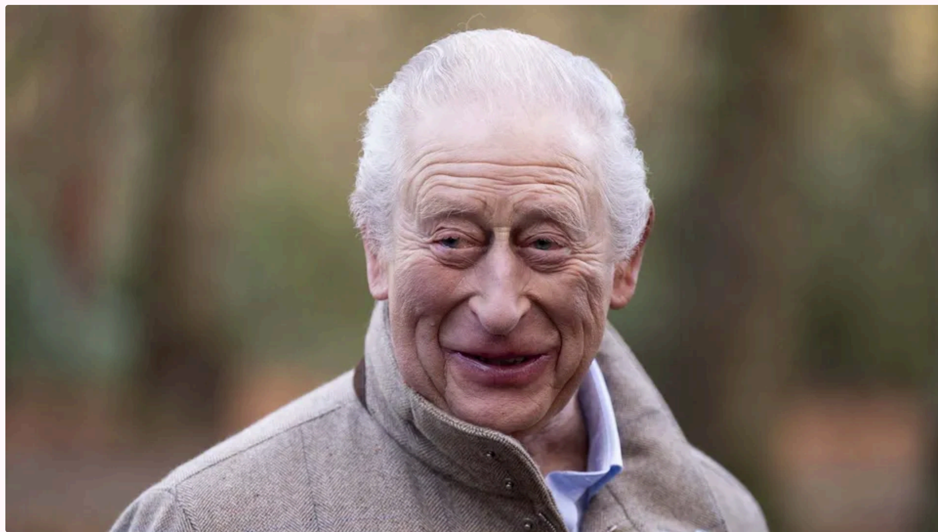
Король сам збирав гриби для улюбленої страви

17 червня, 14.42 🗨️ Этот материал также можно прочитать на русском