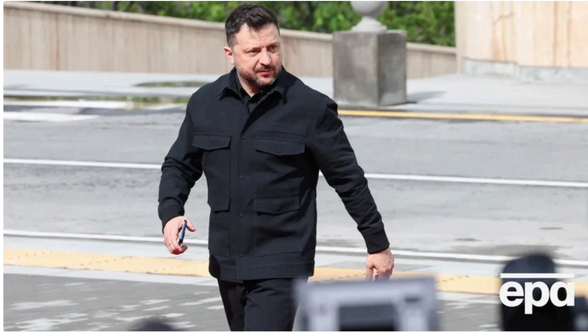
Більшість українців довіряють Зеленському, але після війни хочуть бачити нового лідера

67% українців вважають, що після завершення війни потрібно перезавантажити владу й обрати нового главу держави. Це майже втричі більше, ніж у травні 2023 року, свідчать результати опитування Київського міжнародного інституту соціології (КМІС), які оприлюднили 17 червня.