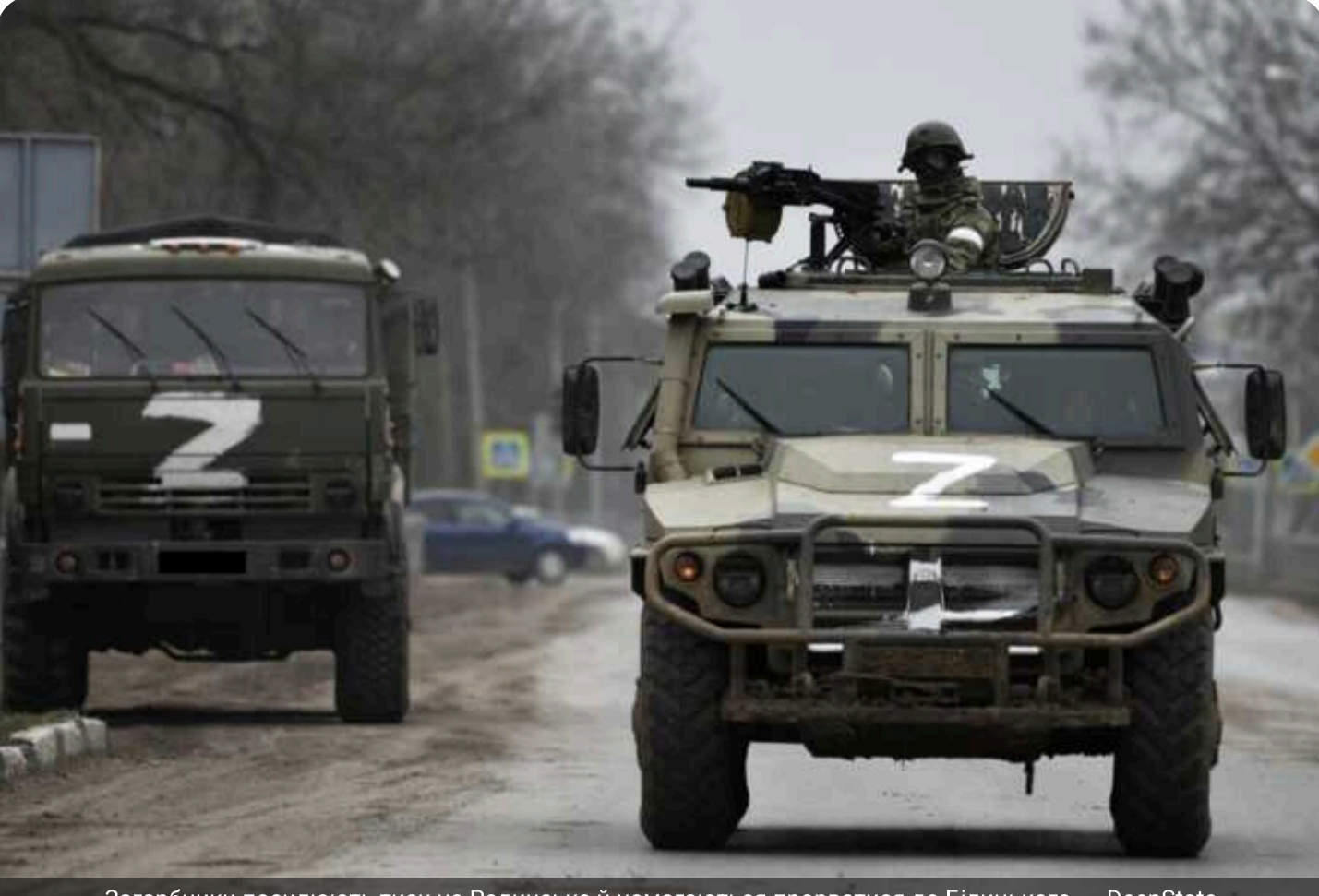
Загарбники посилюють тиск на Родинське й намагаються прорватися до Білицького, — DeepState

Ворог продовжує активно затягувати свої сили в Покровськ та Мирноград, здійснює тиск на агломерацію міст і намагається збільшити контроль над місцевістю.