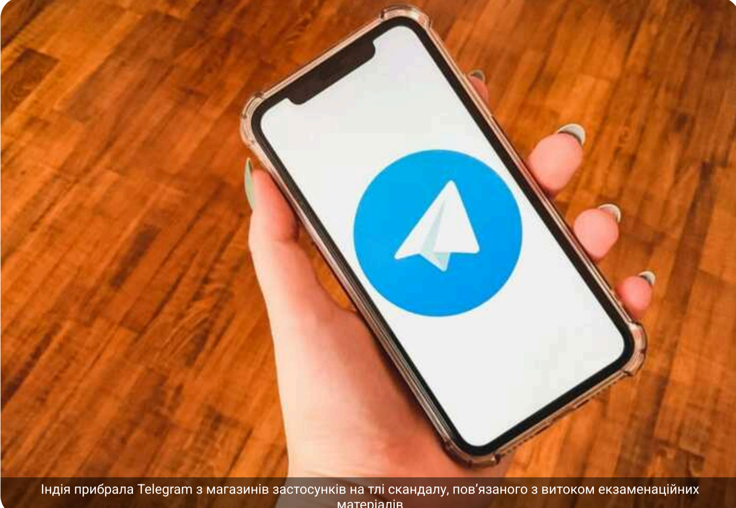
Індія прибрала Telegram з магазинів застосунків на тлі скандалу, пов'язаного з витоком екзаменаційних матеріалів

В Індії месенджер Telegram було видалено з магазинів застосунків App Store та Google Play після розпорядження Міністерства електроніки та інформаційних технологій країни.