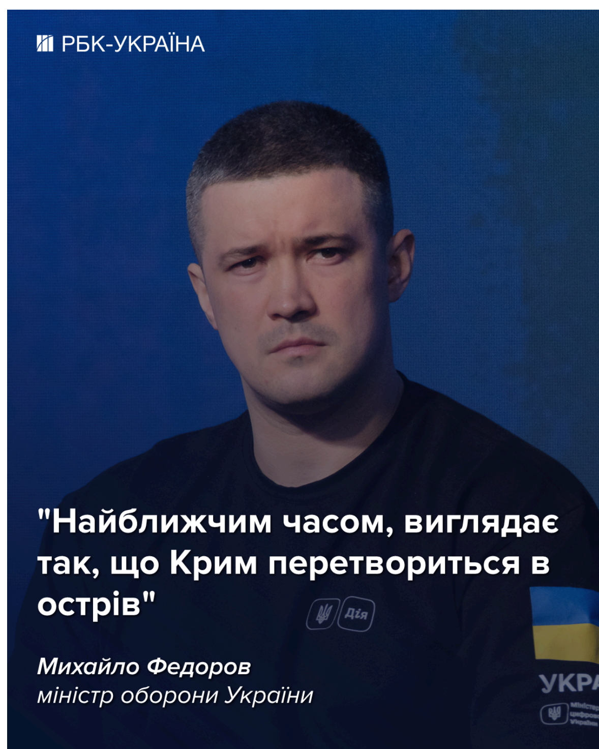
Фото: Федоров заінтригував заявою про Крим (інфографіка РБК-Україна)

Водночас більш детальної інформації щодо майбутніх планів України щодо Криму міністр не розкрив.