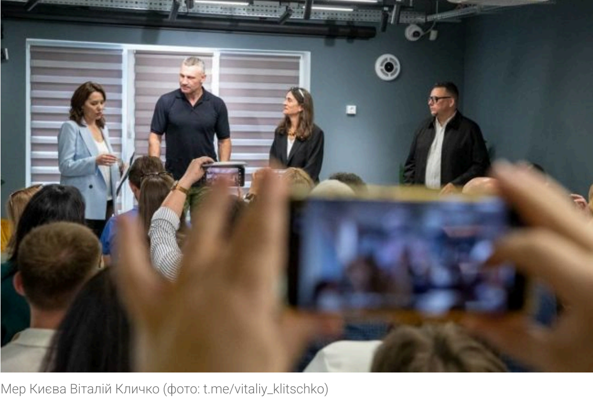
Мер Києва Віталій Кличко

Не витрачай час на шум! Читай тільки суть з РБК-Україна у Google