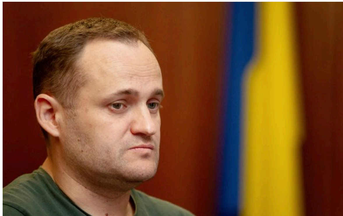
Фото: Олексій Кулеба (Getty Images)