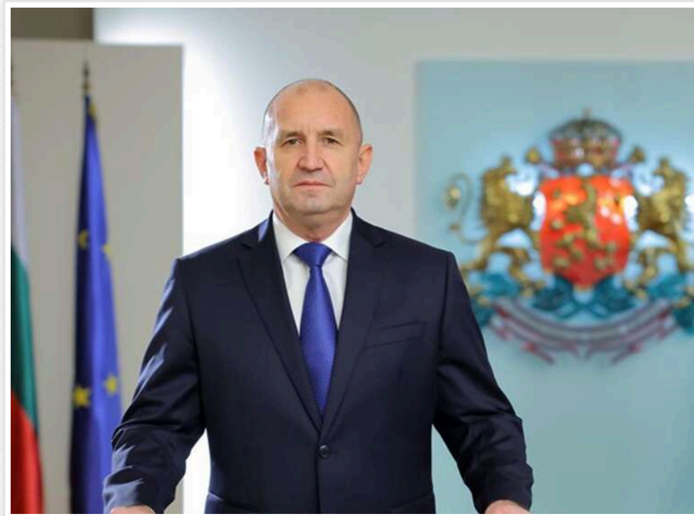
Зміна курсу: Болгарія відмовляється підтримувати енергетичні санкції проти Росії

Міністерство закордонних справ Болгарії повідомило, що країна не має наміру підтримувати частину нових санкцій проти Росії, насамперед в енергетичному секторі, а також обмеження щодо патріарха РПЦ Кирила.