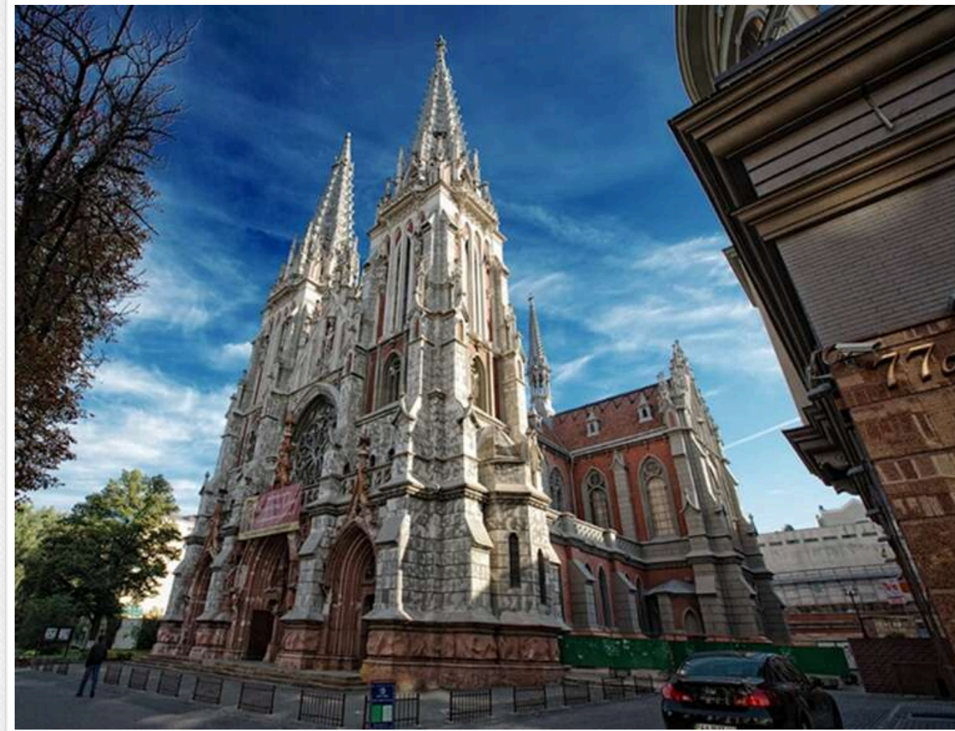
Погашення марки та святкова меса: у Києві вшанували 25-ту річницю візиту Папи Римського до столичного храму

Читати на руском Додати як бажане джерело в Google