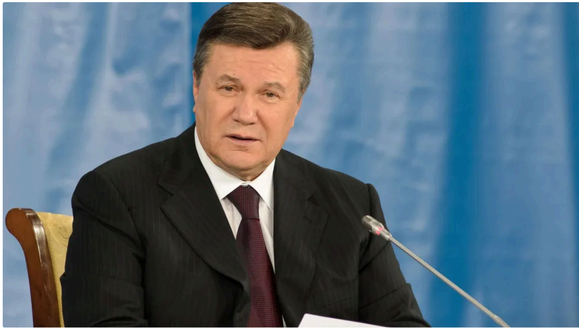
Експрезидента-втікача вже тричі заочно засуджували в Україні

Прокурори спільно зі слідчими Державного бюро розслідувань завершили спеціальне досудове розслідування щодо експрезидента України Віктора Януковича та 16 його соратників у справі про узурпацію влади й злочини проти учасників Революції гідності. Про це 17 червня повідомив генеральний прокурор України Руслан Кравченко у Telegram.