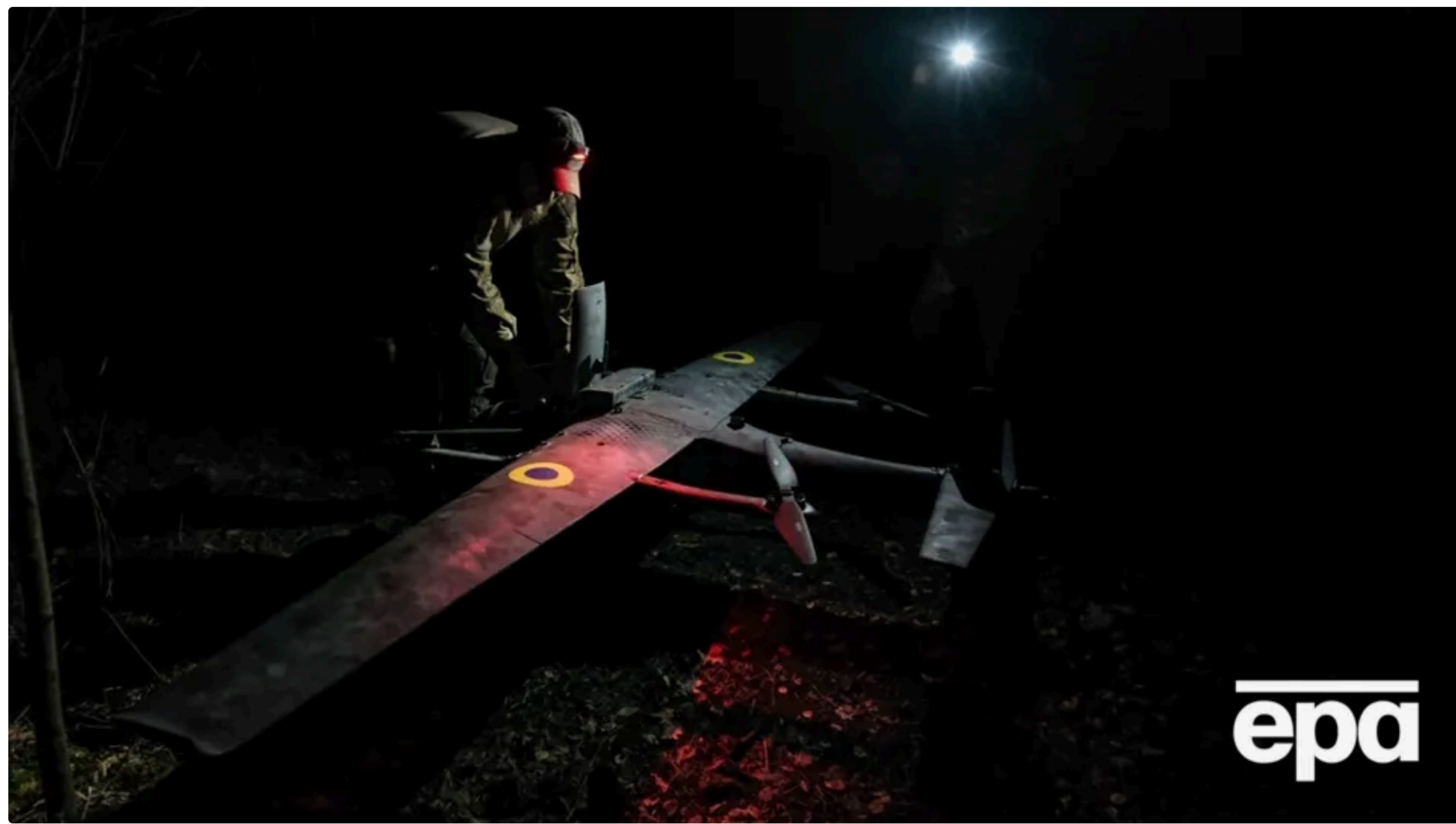
Українські військові активно атакують російські об'єкти нафтопереробки Фото: EPA (ілюстративне)

17 червня, 14.40 🗣️ Этот материал также можно прочитать на русском