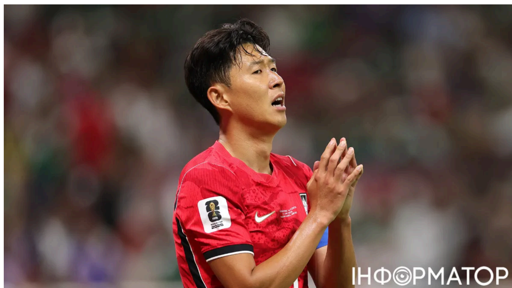
Корея оголосила бойкот журналістам на ЧС-2026.

Збірна Південної Кореї спровокувала медіаскандал під час чемпіонату світу з футболу 2026 - команда повністю відмовилася від спілкування з пресою. Скандальні події навколо мундіалю почалися ще з перших днів турніру - відкриття чемпіонату пройшло на тлі масових протестів у Мексиці. Цього разу конфлікт спалахнув уже безпосередньо в таборі однієї зі збірних. Каталізатором став інцидент, пов'язаний із капітаном корейської команди Сон Хин Міном.