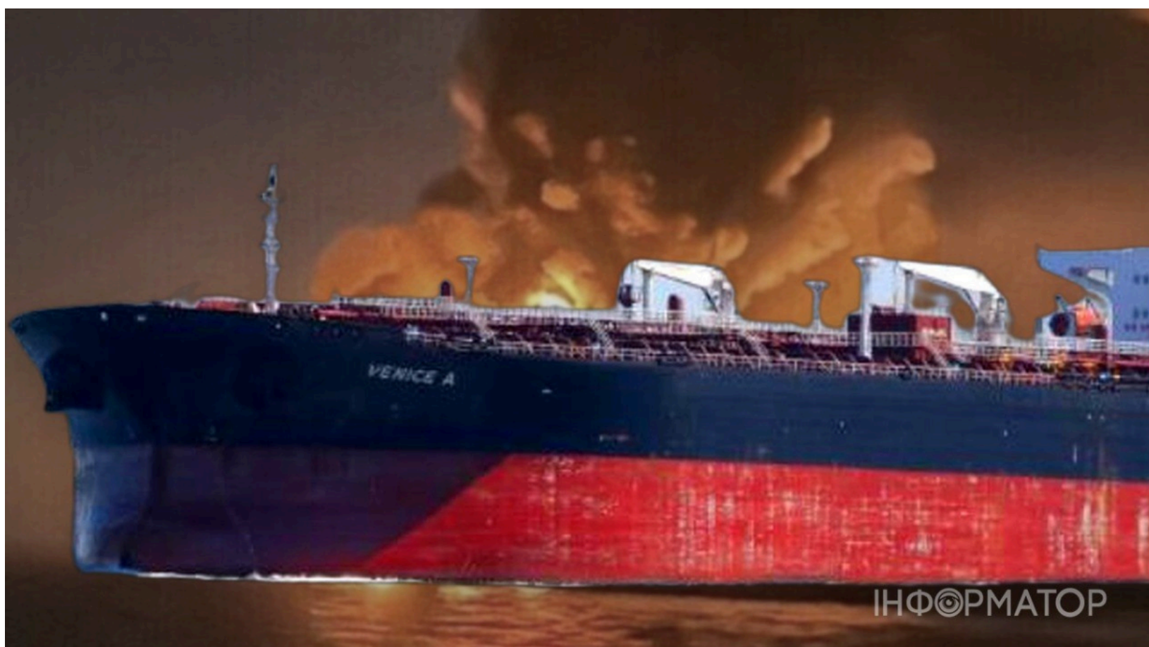
Удар по танкеру тіньового флоту РФ у Чорному морі

Сили оборони України завдали удару по підсанкційному танкеру тіньового флоту Росії в акваторії Чорного моря. Подібні судна тіньового флоту РФ потрапляли під удар і раніше, однак цього разу ціль знаходилась у Чорному морі. Ураження підтверджене - ступінь пошкоджень уточнюється. Крім того, у ніч на 17 червня вражено автомобільні мости та командні пункти противника на півдні та сході України.