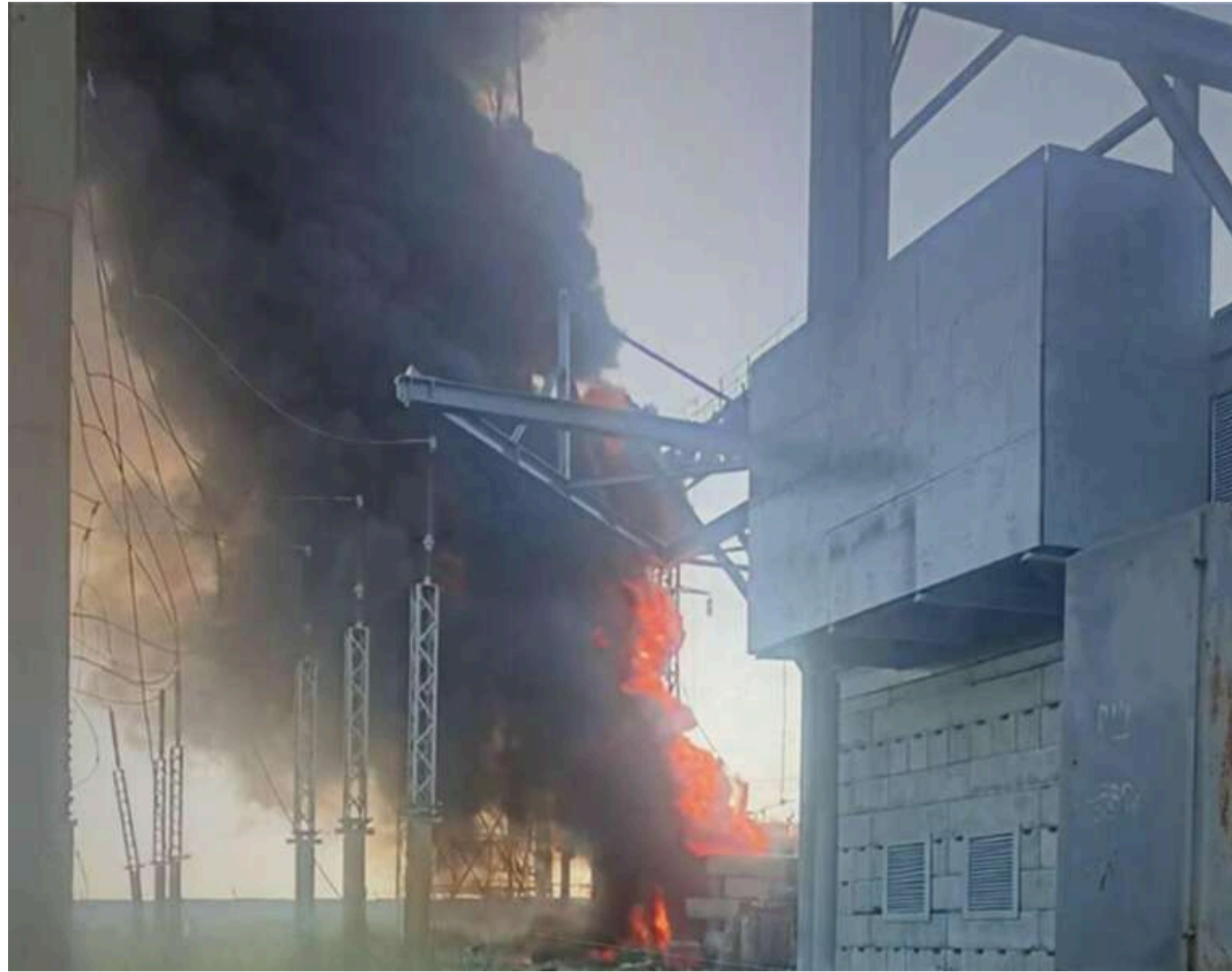
Ворожий удар по об'єкту ДТЕК: на Дніпропетровщині без світла залишилися понад 19 тисяч родин

Вранці ворог атакував об'єкт ДТЕК у Дніпропетровській області.