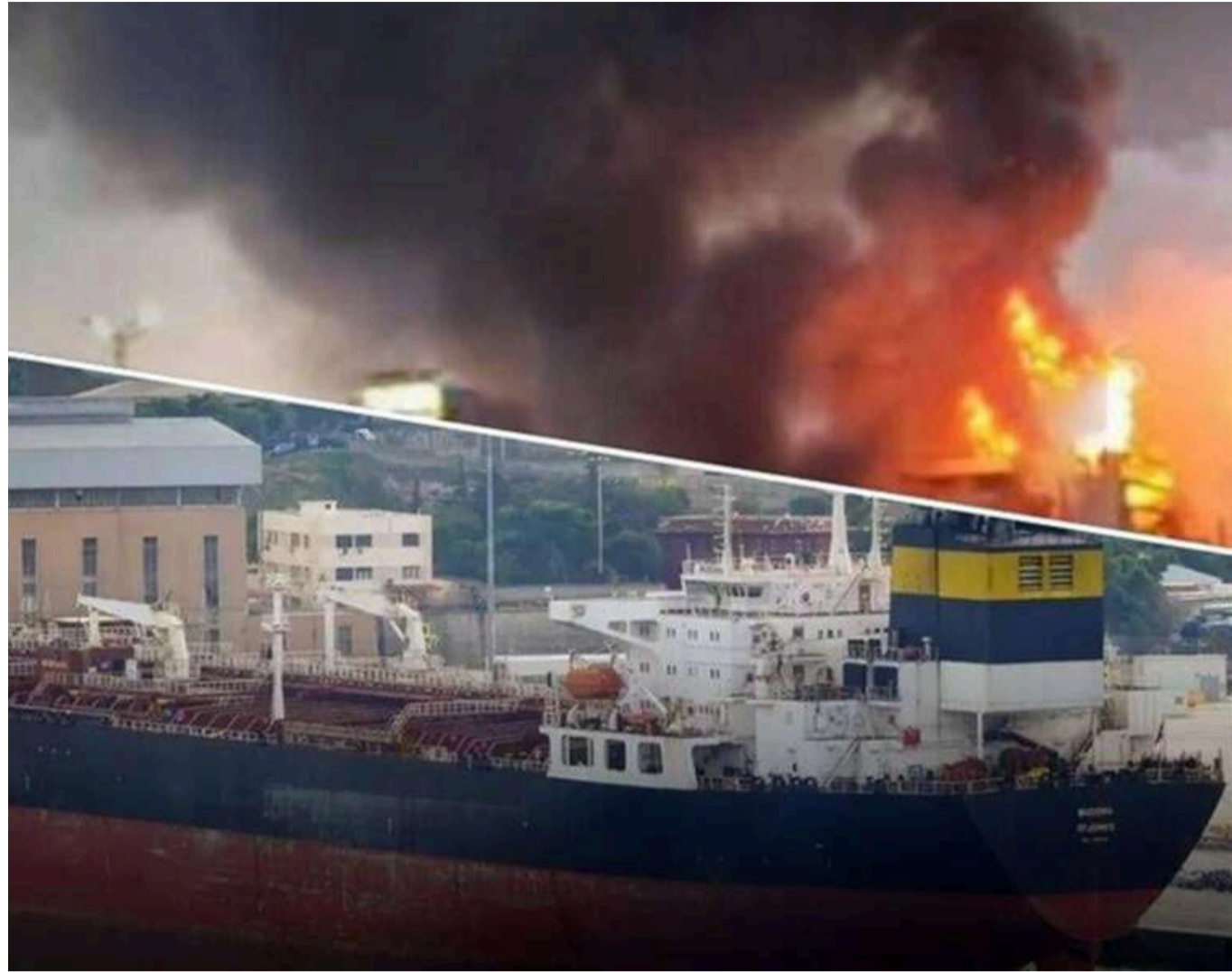
Ураження нафтового танкера та мостів на окупованій Херсонщині: у Генштабі розповіли про успішні операції

16 червня та в ніч проти 17 червня Сили оборони України завдали ударів по танкеру тіньового флоту РФ, об'єктах логістичної інфраструктури та пунктах управління російських військ.