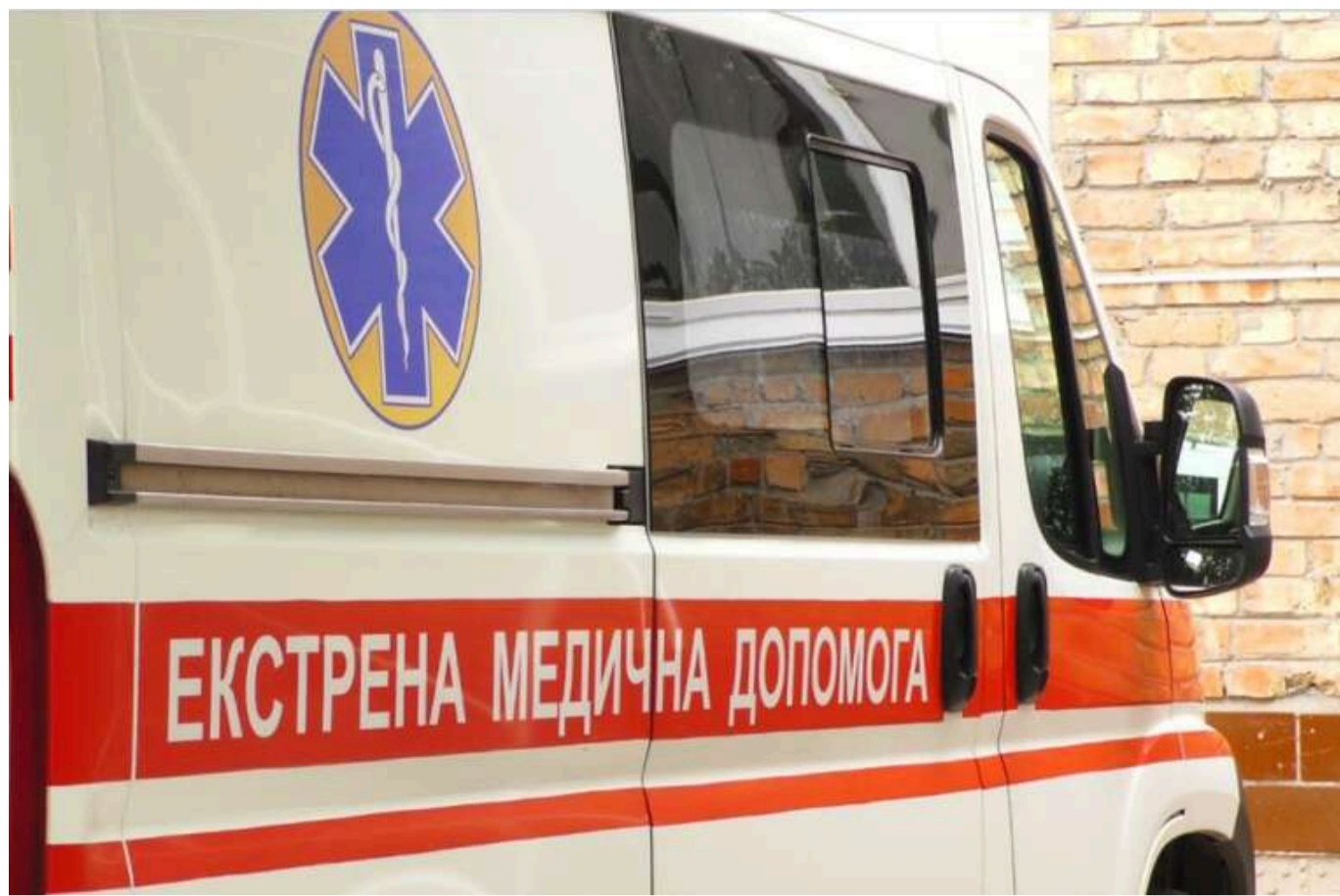
«Неперевірені твердження»: Департамент охорони здоров'я Києва відреагував на критику роботи медиків під час тривоги

У Київській міській адміністрації охарактеризували сюжет ТСН про те, що швидка відмовлялася виїжджати до пораненого киянина під час повітряної тривоги та обстрілу, як «неперевірені заяви».