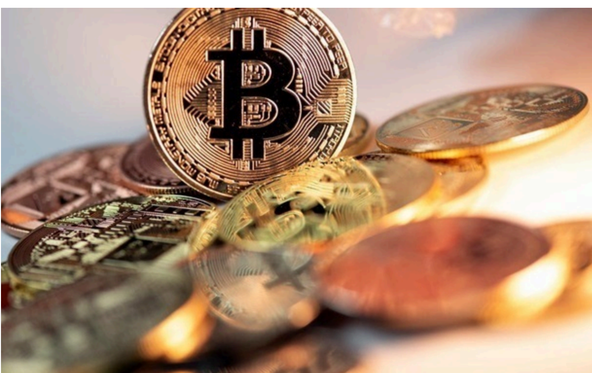
Серед народних депутатів Верховної Ради криптовалюту задекларували 16 осіб із 391

Активно криптовалюту декларують представники Нацполіції, прокуратури, військовослужбовці, представники судової системи та працівники міських рад.