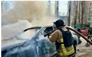
СБУ встановила особи росіян, які вбивали дронами цивільних у Херсоні 3 червня 2026, 12:20