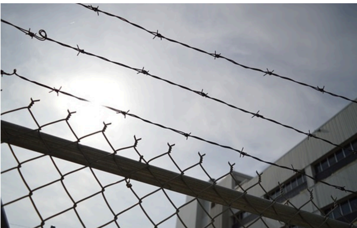
Заочно повідомлено про підозру тюремнику з Луганщини

Чоловік влаштував полоненим так звану "прийомку", коли їх були гумовими кийками по різних частинах тіла та голови під час прибуття до колонії.