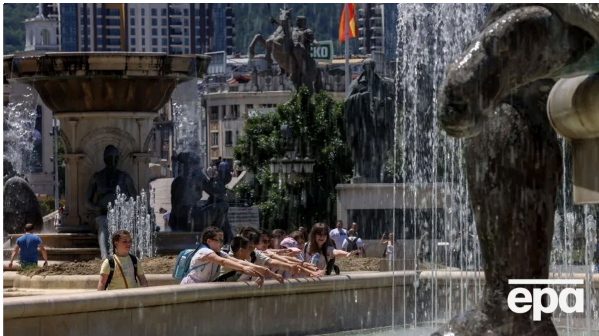
Спека з Африки поширюється Європою

Гаряче повітря із Сахари вже дісталось заходу Європи, тож днями максимальні температури в низці країн можуть сягнути орієнтовно 34–36 °С, перевищивши кліматичні показники 1991–2020 років. Про це 17 червня повідомило The Guardian.