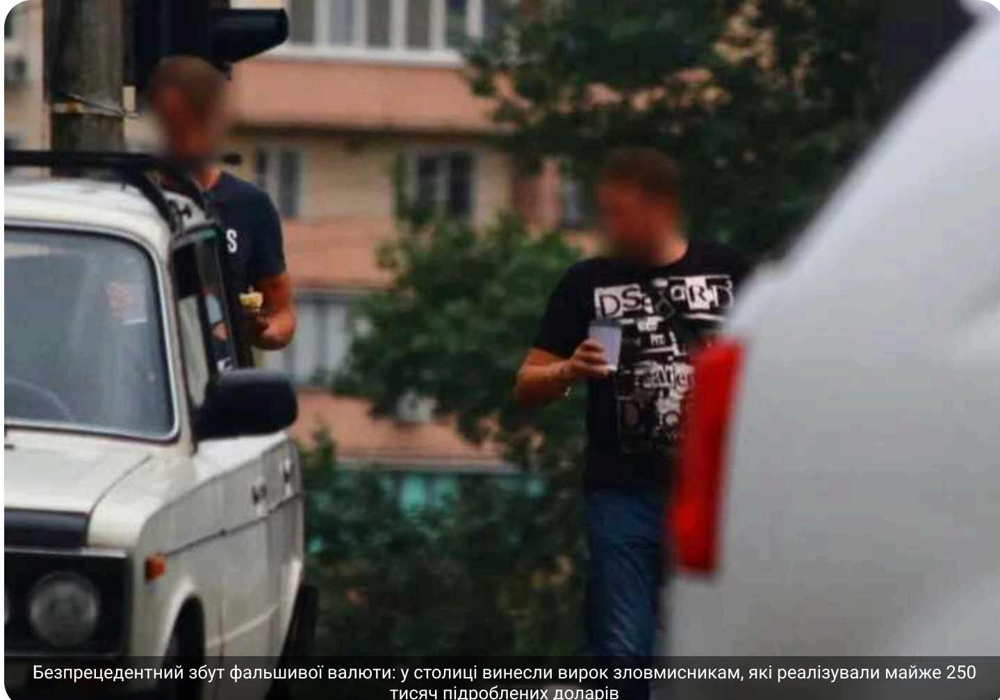
Безпрецедентний збут фальшивої валюти: у столиці винесли вирок зловмисникам, які реалізували майже 250 тисяч підроблених доларів

У Києві двох чоловіків засудили до 9 років позбавлення волі за збут підроблених американських доларів на суму близько 250 тисяч доларів США.