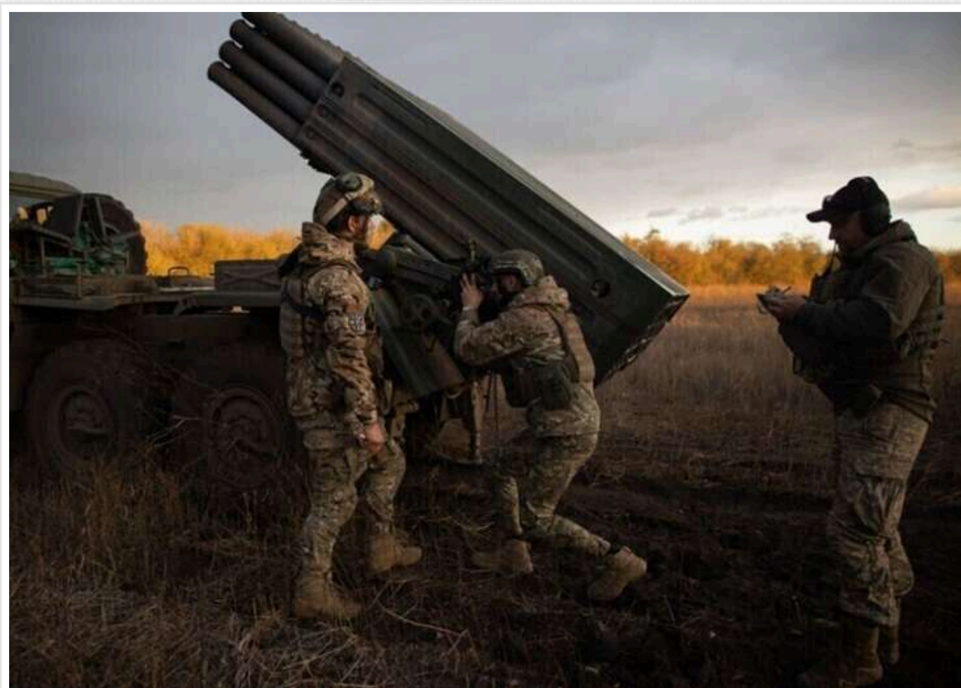
Втрати ворога: за добу ліквідовано понад 1200 окупантів та сотні одиниць техніки

Читати на руськом Read in English Додати як бажане джерело в Google