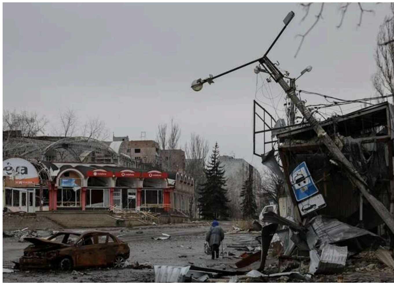
Росіяни просунулися біля Костянтинівки та зайшли в межі міста, – DeepState

Російські війська просунулися в районі Костянтинівки, а також безпосередньо в межі міста.