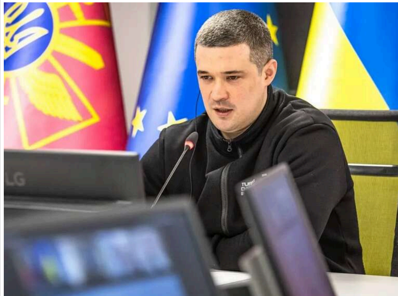
Міністр оборони Федоров про стосунки зі Сирським: «Ми в одній команді, але бувають жорсткі дискусії»

Між Міністерством оборони та головнокомандувачем ЗСУ Олександром Сирським іноді виникають певні розбіжності в підходах до окремих питань.