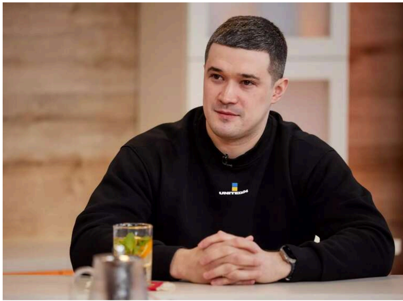
Михайло Федоров: Часткове звільнення військових розпочнеться наприкінці осені

У Міноборони розроблять спеціальний "калькулятор", за допомогою якого кожен військовий зможе вирахувати час свого звільнення зі служби.